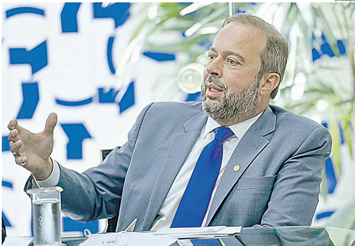
SILVEIRA fez anúncio durante agenda na Paraíba. No Estado, programa recebeu mais 90 mil famílias desde 2022

Só em 2022, a distribuidora inseriu cerca de 90 mil novas famílias